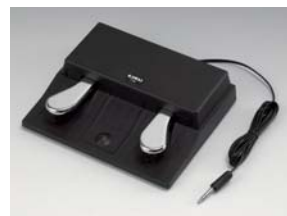
F-20 Pedal Doble