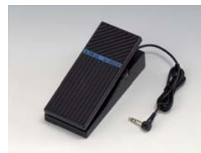
V-20X Pedal de Expresión

La disponibilidad de accesorios opcionales puede variar según el área. Por favor consulte a su distribuidor KAWAI.