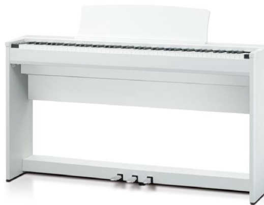
CL36 Blanc satiné haute qualité