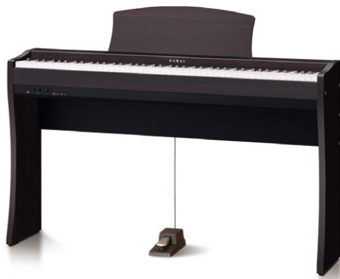
CL26 Bois de rose haute qualité